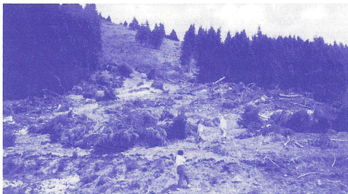
Les dégâts de l'avalanche d'avril au Cret.

Une avalanche sur les pentes du MORCLAN, a fait - début Avril - quelques dégâts, déracinant de nombreux sapins et endommageant le sentier du CRET.