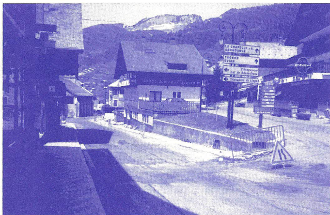
Encore un bout de trottoir en cour de réalisation.

La parcelle partant de l'Office jusqu'au square (à hauteur du cinéma) était en mai dernier, en cours de réalisation.