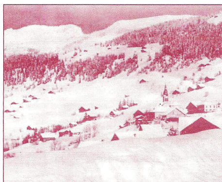
De 1947 à 1997, que de temps écoulé et de changements survenus dans la station !

De nombreuses manifestations animeront donc cet hiver, plus qu'à l'accoutumée, la vie de la station et mobiliseront une grande partie des Châtellans, heureux de partager leur histoire et leurs traditions avec les touristes.