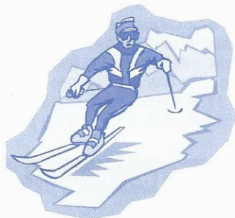
Les compétiteurs et leurs entraîneurs ETOILE D'OR

Ambiance et angoisse se mêlent à chaque passage de nos champions dans les slaloms parallèles.