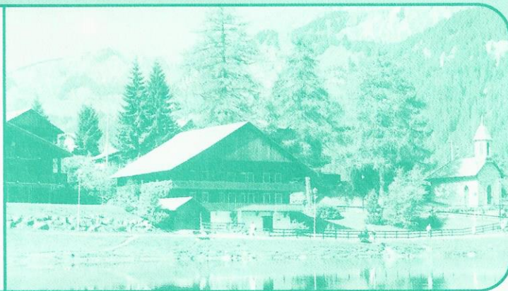
Lac de Vonnes

Bulletin d'information de l'Association Amicale des Résidents de CHATEL – B.P. n° 34– 74390 – CHATEL